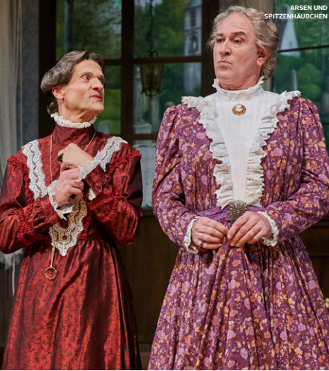
ARSEN UND SPITZENHÄUBCHEN

16:00 OPER CINDERELLA Musical von Richard Rodgers / Oscar Hammerstein II 19:00 Uhr Einführung im Kronleuchterfoyer